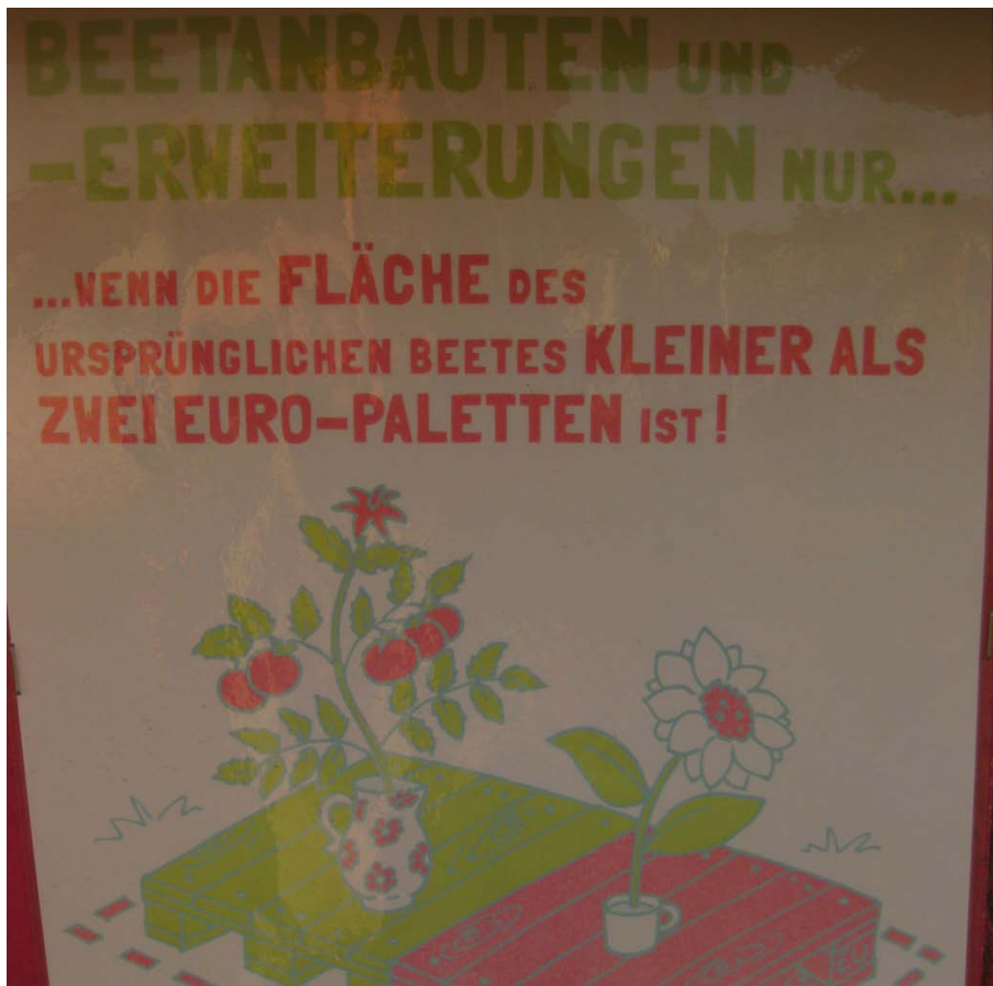
Abbildung 17

Ein Schild der Initiatoren, das Beeterweiterungen regeln soll.