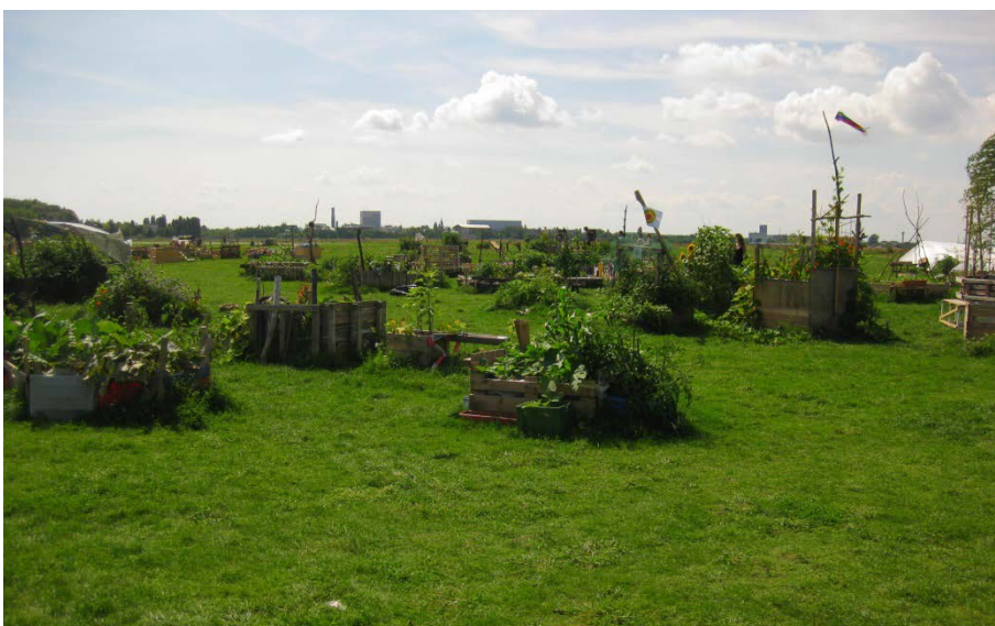
Abbildung 10

Die ersten Beete in der Mitte des Gartens sind klein und zumeist aus Naturholz gebaut.