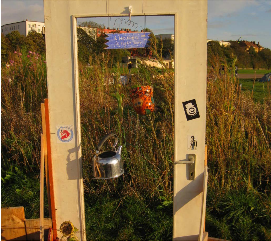
Abbildung 9

Eine auf der Straße gefundene Tür dient als gestalterisches Element. Auf dem Schild steht „Heaven is right here“.