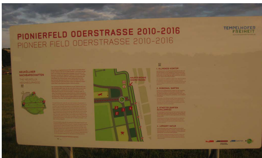
Abbildung 18

Ein von der Senatsverwaltung aufgestelltes Metallschild, das die vier Pionierprojekte an der Oderstraße vorstellt. Oben rechts ist das Logo der Tempelhofer Freiheit zu sehen.