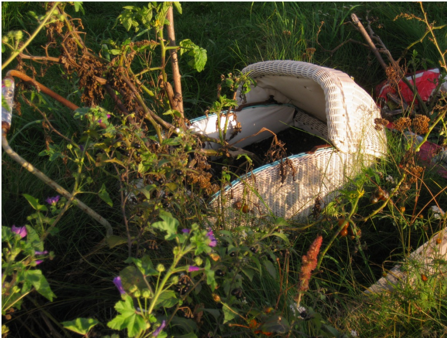
Abbildung 13

Upcycling mit einem alten Kinderpuppenwagen.