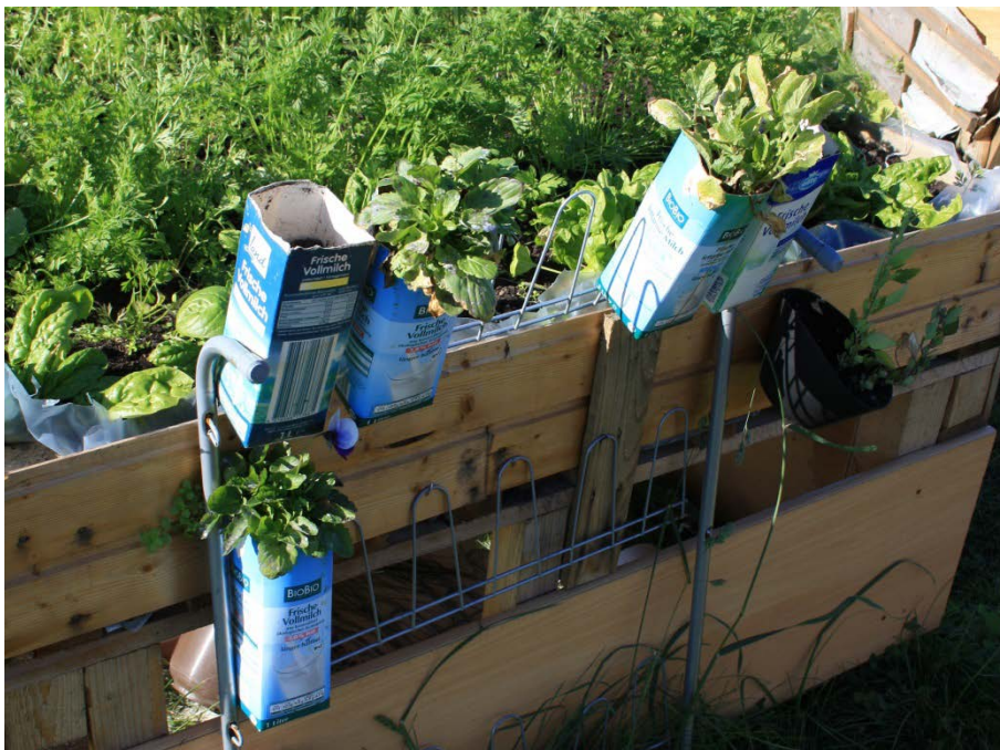
Abbildung 14

Ein weiteres Beispiel für upcycling . Gebrauchte Milchtüten werden als Blumentöpfe genutzt.