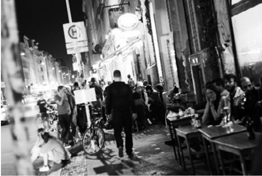
Abb.9: Oranienstraße am Abend.

Quelle: https://www.commonswiki.org/wiki/User:Fred , Photo Sep.2010.