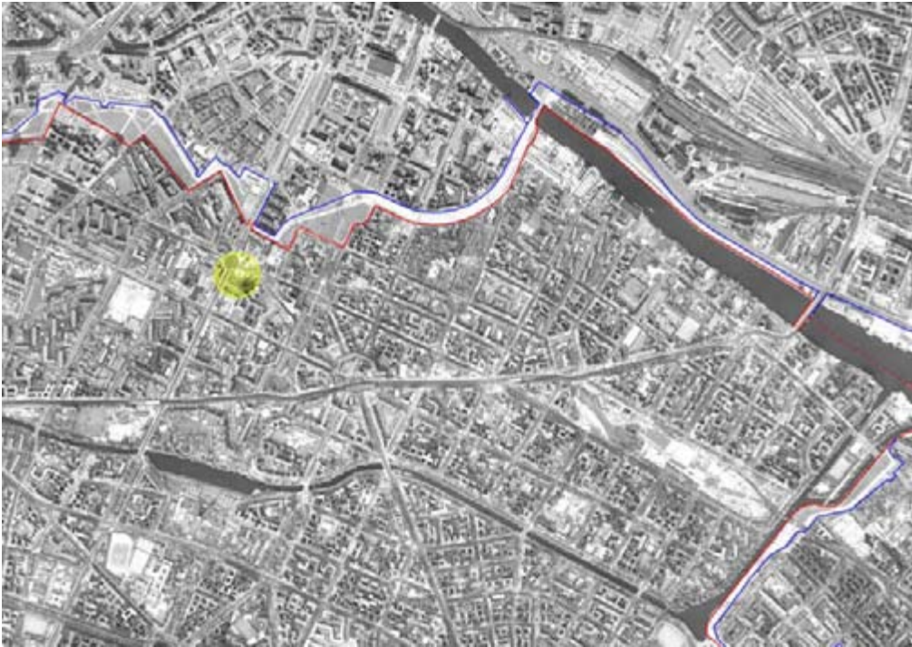
Abb.7: Ehemaliger Mauerverlauf, Karte selbst bearbeitet.