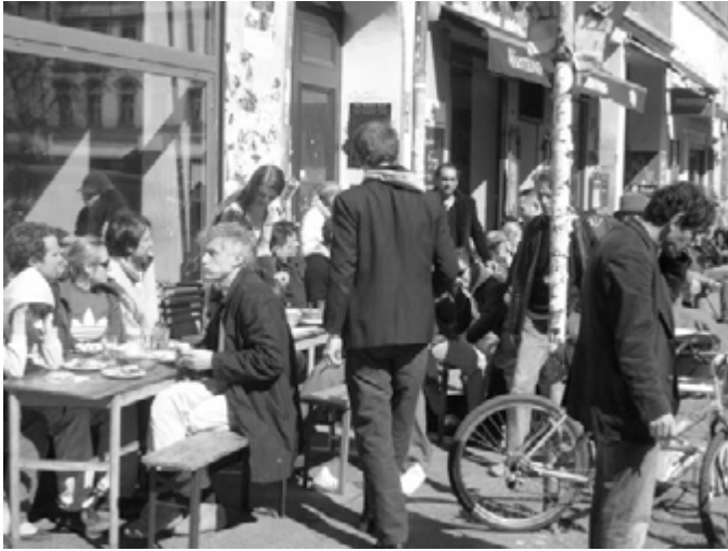
Abb.11: Oranienstraße am Tag. Photo 2010.