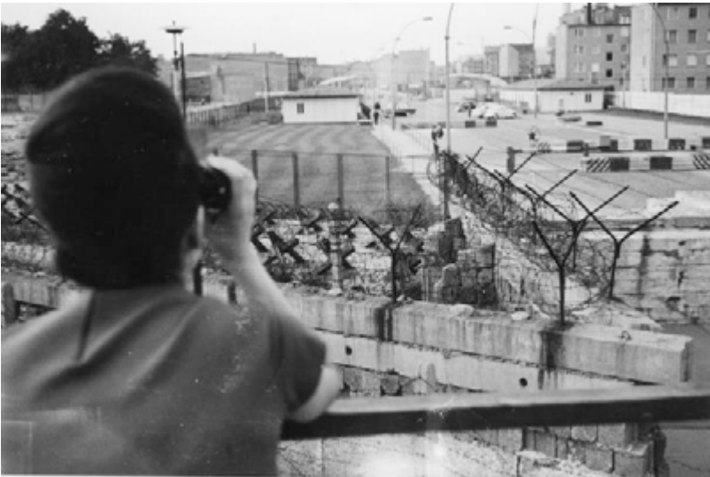
Abb.8: Ehemaliger Grenzübergang Moritzplatz/Heinrich Heine Straße. Quelle: https://www.berliner-unterwelten.de . („Fluchthilfe“).