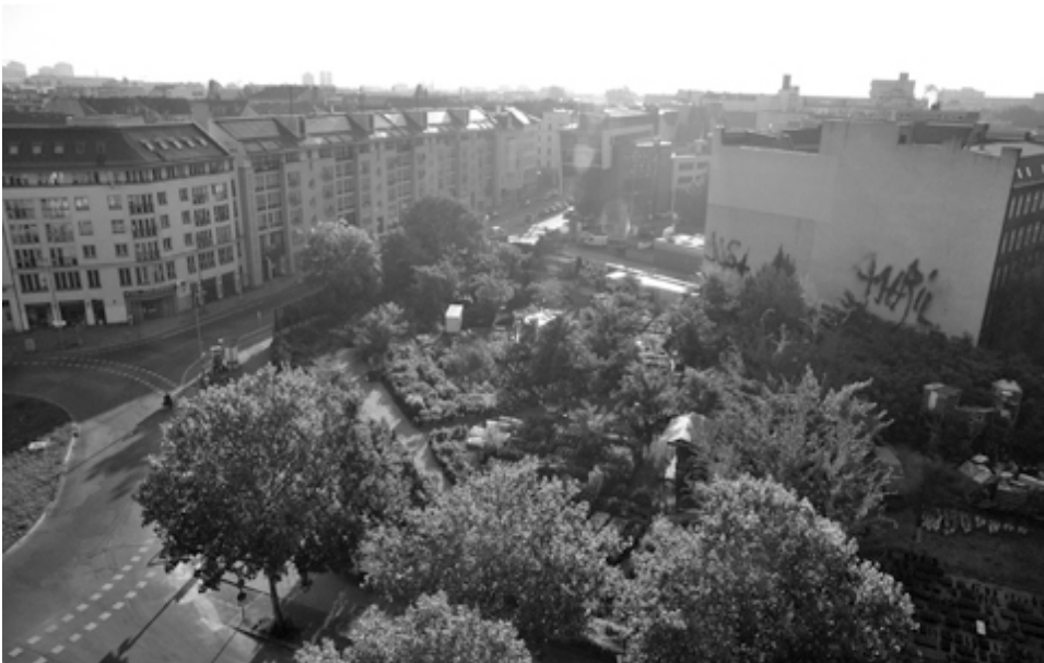
Abb.10: Luftaufnahme Prinzessinnengarten.