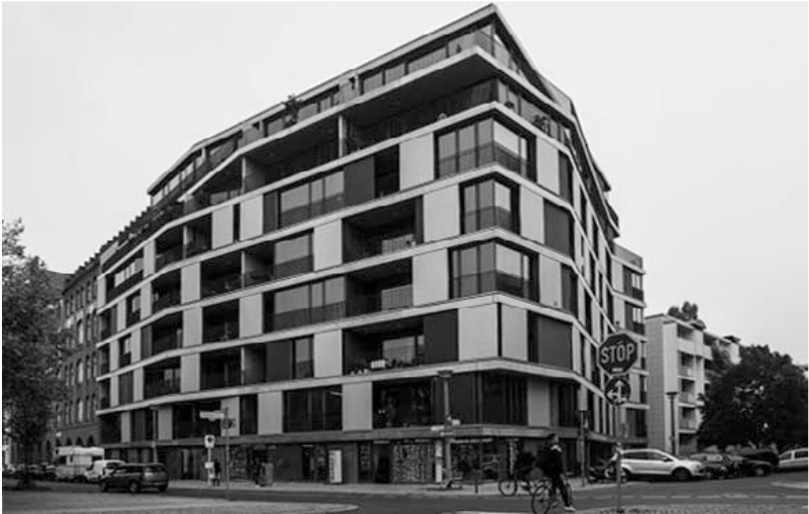
Abb.13: Engeldamm Loft-Appartement.