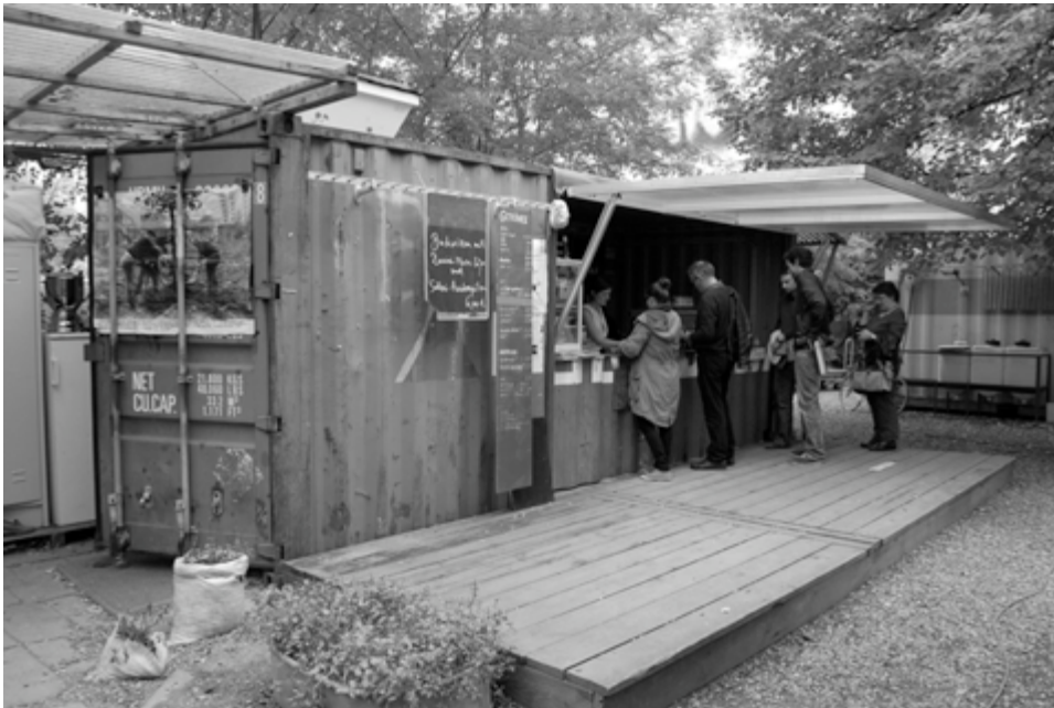
Abb.1: Prinzessinnengarten, Bar im Überseecontainer.