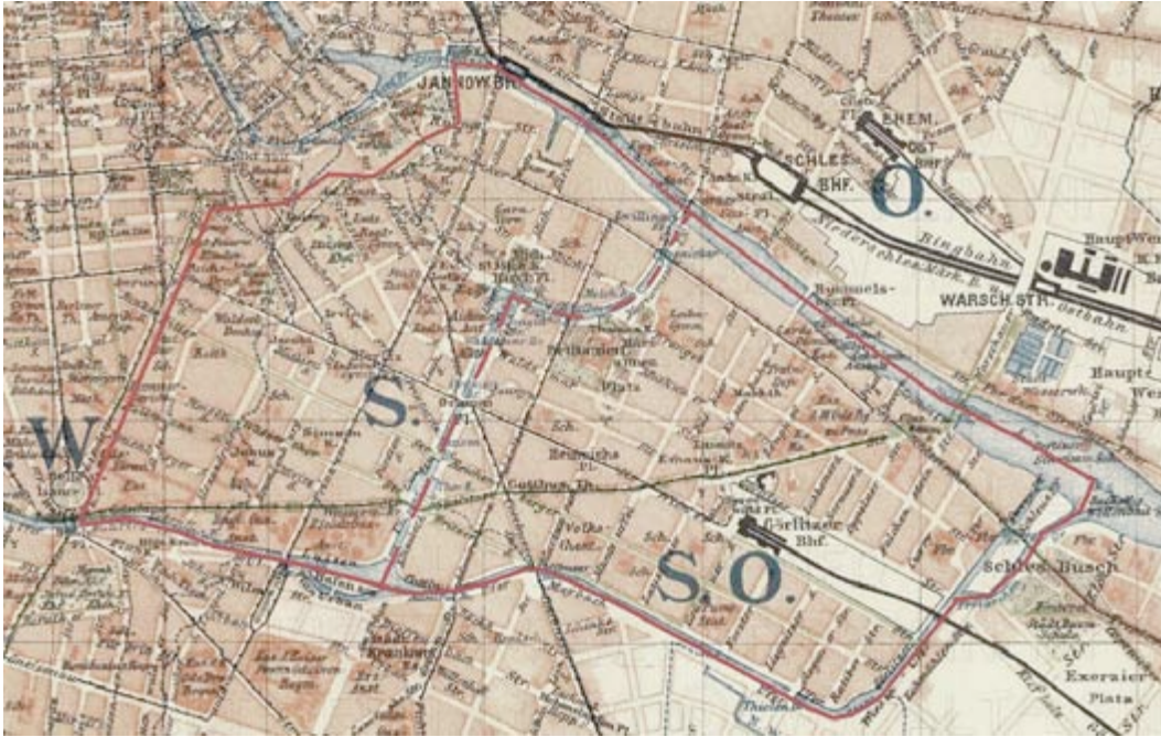
Abb.3: Alt Luisenstadt, Karte erstellt 1987.