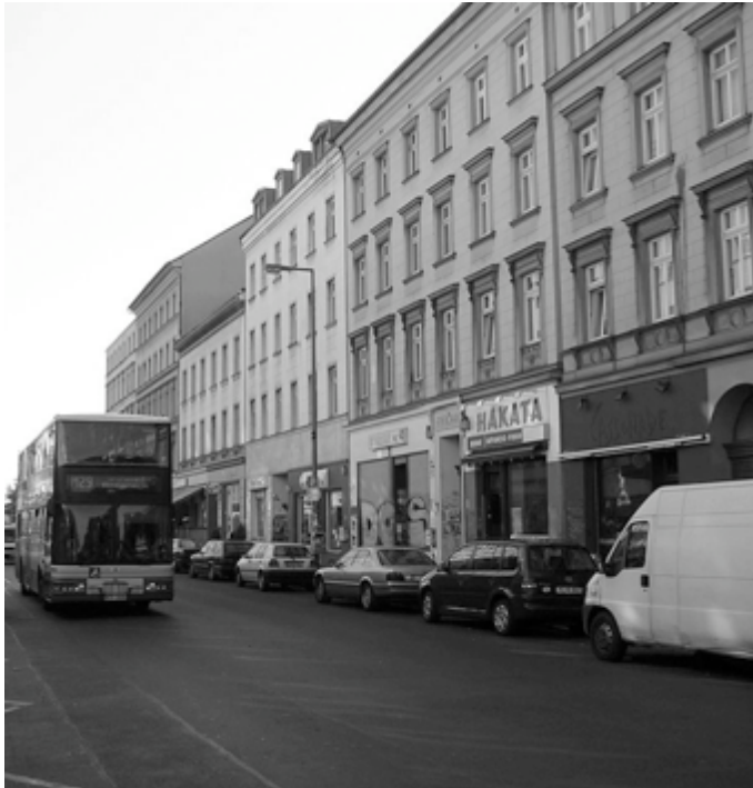
Abb.5: Fassadenansichten Oranienstraße, Wilhelminischer Stil.