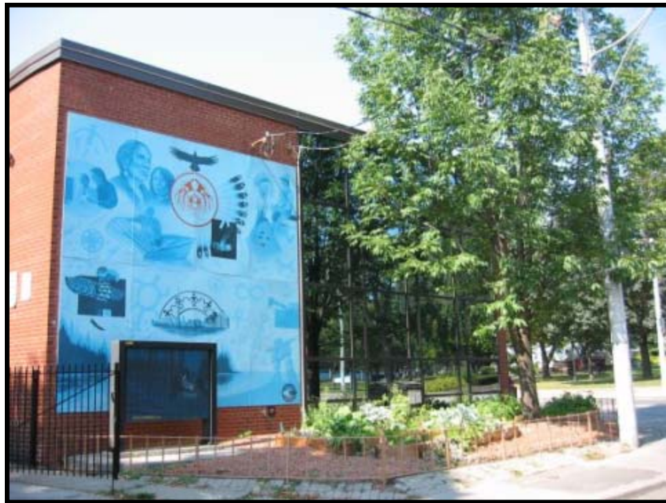
Abb. 2: Der Miziwe Biik community garden in Toronto.

Der Garten „Miziwe Biik“ 7 existiert seit Juni 2003 neben dem gleichnamigen Beschäftigungszentrum für aborigines . Er ist sehr klein, nur ca. 50 m 2 groß, jedoch groß genug, um sowohl von der Gestaltung als auch der Pflanzenauswahl her wichtige Bezüge zur Geschichte und Tradition der aborigines der Region von Ontario aufzugreifen. So finden sich die „Drei Schwestern“ (Mais, Bohnen, Zucchini) als bedeutsame Nutzpflanzen und wichtige einheimische Wildblumen. Zudem werden weitere kulturell und spirituell bedeutsame traditionelle Pflanzen wie das sweet grass und Tabak angebaut. Der Garten wird von Beschäftigten und BesucherInnen des Job Centres in Zusammenarbeit mit Evergreen betrieben und dient v.a. Demonstrationszwecken. Darüber hinaus geht es um Ernährungssicherung, das Erlernen von Fähigkeiten für die Mitglieder der aboriginal community und community building.