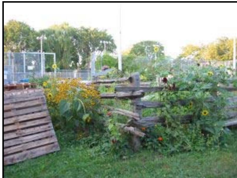
Abb. 1: Der Dufferin Grove Park community garden in der Torontoer Innenstadt.

städtischen Flächen, für die es keine Nutzung gab. 4 In Toronto gab und gibt es kein solches Angebot an ungenutzten Freiflächen im inneren Stadtbereich. Auf der anderen Seite gibt es jedoch selbst im Stadtzentrum viele kleine Privatgärten vor und hinter den Reihenhäusern bzw. town houses , die sehr intensiv begärtnert werden. Neben einer Vielfalt von Blumen werden in Torontos Innenstadt also ohnehin Tomaten, Kürbisse, Paprika, Kräuter etc. angebaut. Diese Möglichkeit besteht allerdings nur für HausbesitzerInnen mit angrenzendem Garten. MieterInnen in Apartmentblöcken und Hochhäusern hingegen fehlen entsprechende Möglichkeiten zum Gärtnern, sei es zum Anbau von gesundem Gemüse, als „ green gym “ oder einfach zur erholsamen Freizeitbeschäftigung. Da nun wenig Brachflächen im Zentrum der Stadt vorhanden waren, mussten andere Orte für die urbanen Gärten gefunden werden. Deshalb befinden sich die community gardens in Toronto größtenteils in städtischen Parks und auf dem Gelände öffentlicher Einrichtungen wie Kirchen, Bibliotheken, Community Centres und Gesundheitseinrichtungen. Zur Zeit gibt es in Toronto ca. 100 community gardens . Ungefähr 30 von ihnen befinden sich in öffentlichen Parks 5 , die anderen entstanden im Zusammenhang mit den erwähnten sonstigen Einrichtungen.