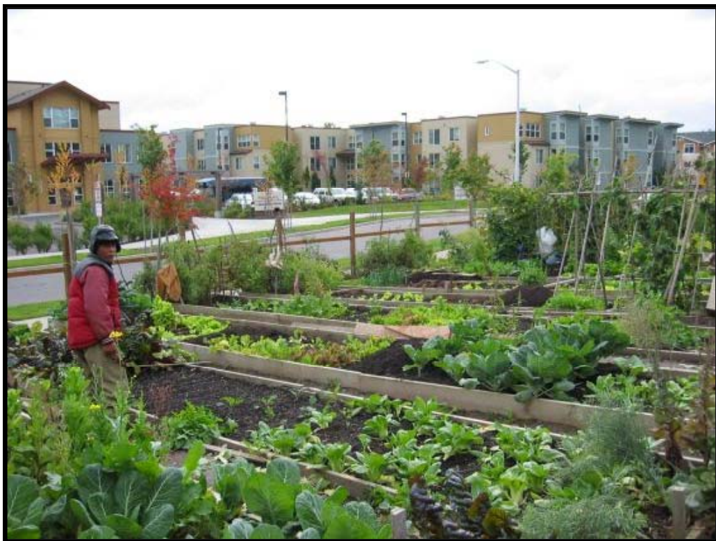
Abb. 7: Der Market Garden New Holly Süd-Seattle.

Das Programm wird von der Stadtverwaltung in Kooperation mit dem ehrenamtlichen Zusammenschluss der Friends of P-Patch und der Seattle Housing Authority betrieben. Derzeit gibt es 19 dieser Gärten. Drei von ihnen wiederum sind market gardens, d.h., Produkte aus diesen Gärten können – im Gegensatz zu den anderen P-Patches – verkauft werden und der Gewinn kommt größtenteils den gardeners zugute. Diese sind in der Regel neu eingewandert, überwiegend aus Südostasien. Der Verkauf erfolgt über ein Bio-Abonnement-Kisten-System. Neben den ökonomischen Zielen der Einkommensverbesserung verfolgt das Projekt auch soziale und allgemein qualifizierende Ziele – z.B. den Erwerb von Englischkenntnissen und Vermarktungsfähigkeiten (Goodlett 2003).