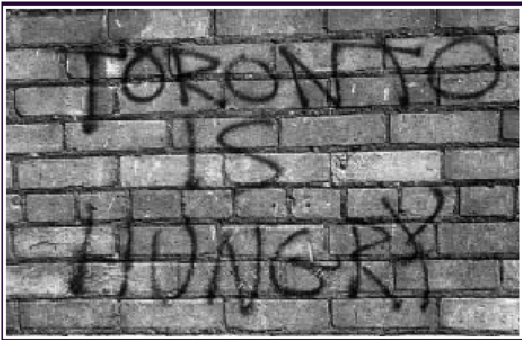
Abb. 3: „Toronto hat Hunger“

gelten die teilweise sehr niedrigen Löhne und die sehr geringen Sozialleistungen, die zudem 1995 um 22% gekürzt wurden und seitdem nicht mehr angestiegen sind (Spencer 2003). Gleichzeitig sind in Toronto die Mieten auf dem freien Wohnungsmarkt sehr hoch. Aufgrund einer Gesetzesänderung 1998, dem „Tenant Protection Act“ (sic!), der die Neuvermietung von Wohnungen zu jedem beliebigen Preis ermöglicht, kam es zwischen 1998 und 2002 zu einem Anstieg der durchschnittlichen Mieten für eine Wohnung um 19% (von 808 auf 964 kanadische Dollar) (Oliphant/Thompson 2004). Auch die Zahl der Wohnungen im öffentlich geförderten oder sozialen Wohnungsbau ist gering, entsprechend betragen die Wartezeiten für eine solche Wohnung bis zu 15 Jahre (Food and Hunger Action Committee 2001). Die große Zahl an Personen mit sehr geringen Einkünften muss diese also (fast) vollständig zur Begleichung der Mietkosten verwenden – für Lebensmittel bleibt kein Geld übrig. Die Non-Profit-Organisationen beklagen, dass Arme vor der zweifelhaften Wahl stehen: „Pay the rent or feed the kids“ („die Miete bezahlen oder die Kinder ernähren“). Dass dies keine medienwirksame Übertreibung ist, zeigt eine Studie der Ontario Food Bank Association (s.u.): 65% der food bank Kunden geben mehr als 65% ihres Einkommens für Mietkosten aus (Food and Hunger Action Committee 2001). 8