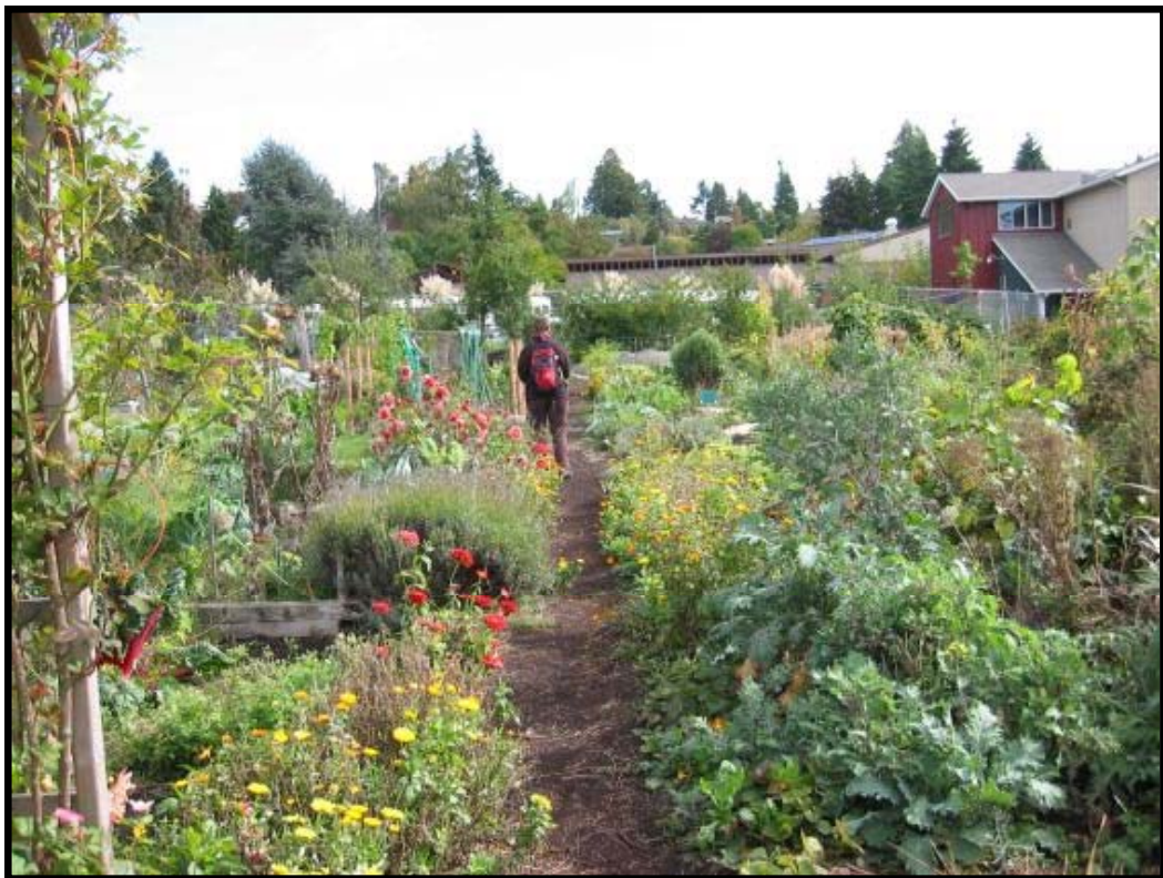
Abb. 6: Der Picardo P-Patch in Seattle.

Darüber hinaus gibt er Diskussionspapiere heraus und betreibt eigene Forschungsvorhaben. In seinen Strategien zur mittel- bis langfristigen Ernährungssicherung spielen die community gardens und andere Formen urbaner Landwirtschaft eine wichtige Rolle. Ein Aktionsplan zur Ernährungssicherung, den ein Stadtrat-Ausschuss unter Mitwirkung des TFPC verabschiedet hat, benennt in seinen Handlungsempfehlungen Gärten ebenfalls als wichtigen Bereich (Food and Hunger Action Committee 2003, 2001). So soll die Stadt Geld für mehr community gardens bereitstellen, besonders in Gebieten mit schlechtem Zugang zu Lebensmitteln und in armen Gebieten. Daneben werden auch die Ursachen des Hungers in Toronto angegangen: die Stadt wird aufgefordert, für höhere Löhne und bezahlbaren Wohnraum zu sorgen.