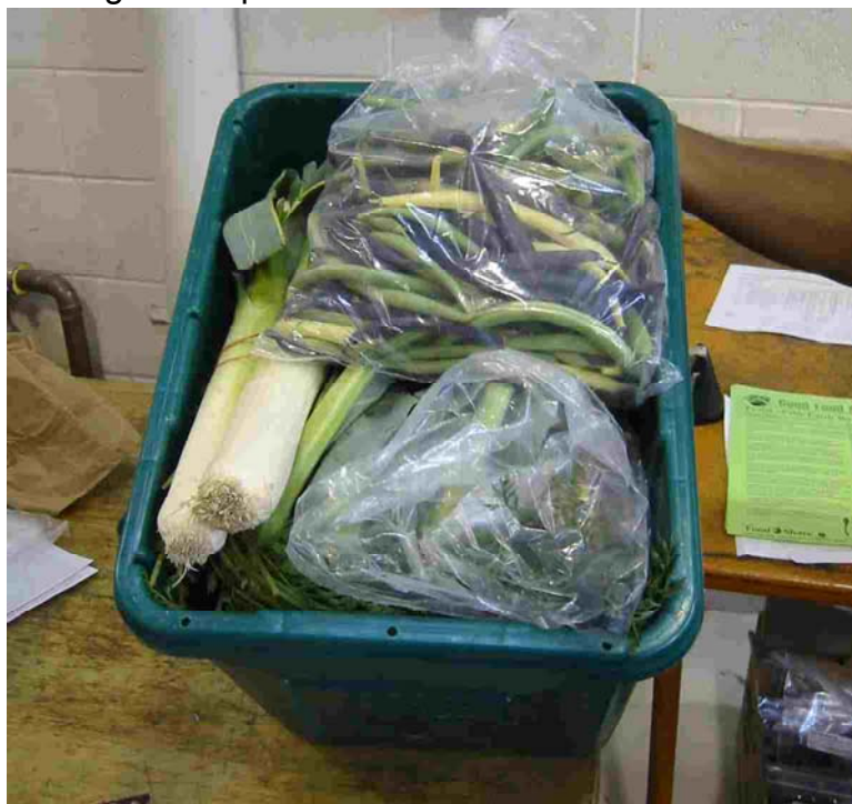
Abb. 5: Eine fertig gepackte Good Food Box.