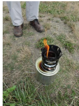
Unterschiedliche Mikrovergaser