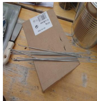
Leere Dosen in unterschiedlichen Größen, Messer mit Schleifstein, Draht