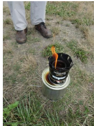
Unterschiedliche Mikrovergasers, Fotos: Shimeles