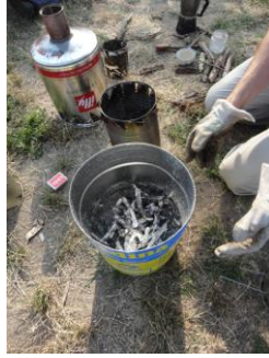
Herstellung von Holzkohle, Fotos: Shimeles