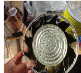
Wichtig: Löcher an der richtigen Stelle und in der richtigen Größe